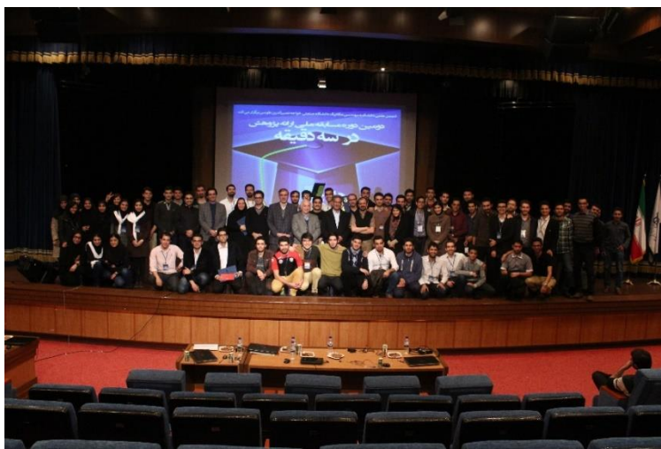
تیم اجرایی سومین دوره مسابقه ملی ارائه پژوهش در سه دقیقه